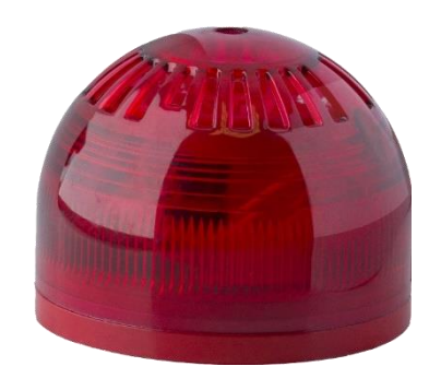
آژیرفلاشر اعلان حریق متعارف RSF-91